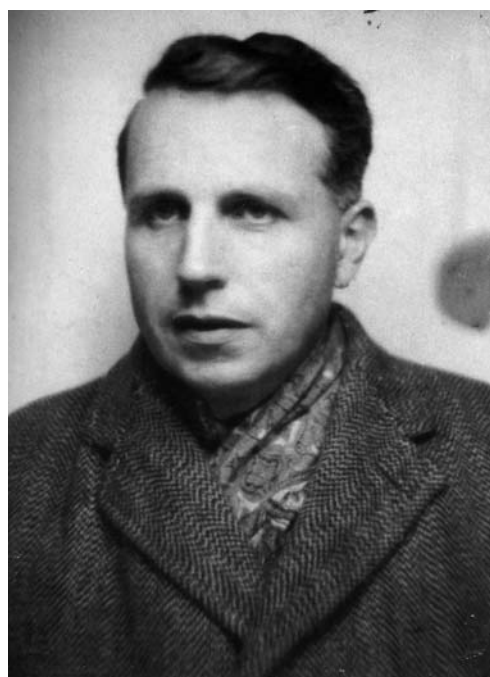
Georges Bataille - vers 1943